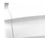
Pearl Snow White