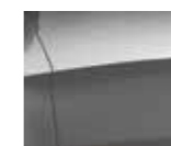
Metallic Glistening Gray