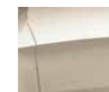
Metallic Clear Beige