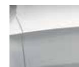
Metallic Silky Silver